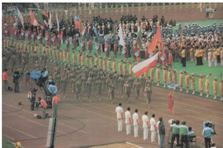
Na zdjęciu: Polska ekipa olimpijska defiluje na łożnickim stadionie w Moskwie

Czterokrotny Mistrz Polski na 100 i 200 m (1976 i 1977), dziewięciokrotny rekordzista Polski.